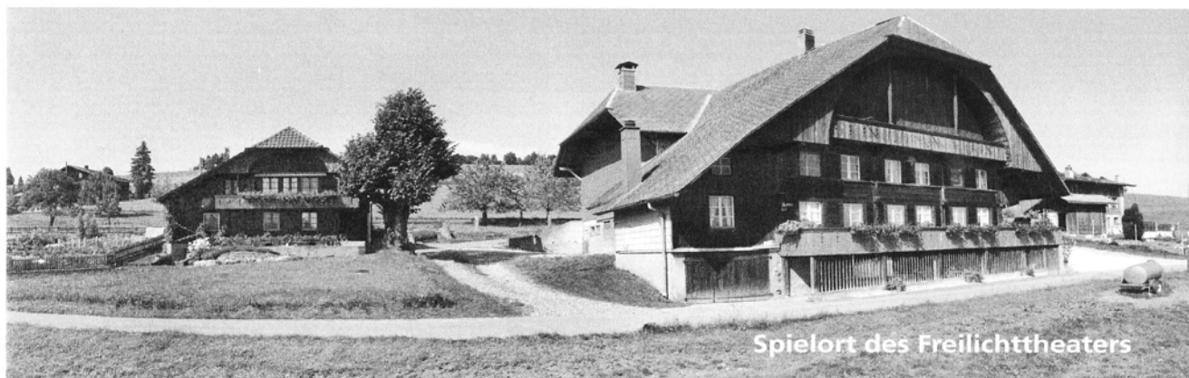
Spielort des Freilichttheaters

Der Alkohol als vermeintlicher Tröster stürzte viele Familien ins Elend, es blieben Geldstagnation und Verdingung. Mitten in dieser Zeit herrschte aber auch grosse Aufbruchsstimmung, 1848 wurde die Eidgenossenschaft gegründet, Eisenbahnen gebaut, und Dampfschiffe auf den Seen gewässert. Die Industrialisierung hatte begonnen. Viele sahen trotzdem keine Zukunft in der Schweiz und wanderten aus und hofften in der neuen Welt auf ein besseres Leben. Einige traten diese Reise nicht ganz freiwillig an, wurden sie doch von den Behörden gedrängt auszuwandern oder gar ausgewiesen oder türmten mit den Spareinlagen der Ersparniskasse. Da waren starke Persönlichkeiten, wie der Vehdokter Trachsel, aus Rüeggisberg von Nöten um geduldig gegen die Hoffnungslosigkeit anzukämpfen und das mit Erfolg.